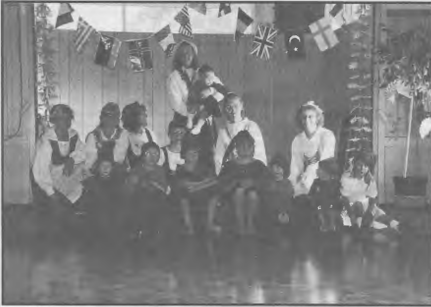
Australian konserttimatka :

Adelaidessa suomalaisten Suvipäivillä 1.1.1991 Tontut kesähelteellä.