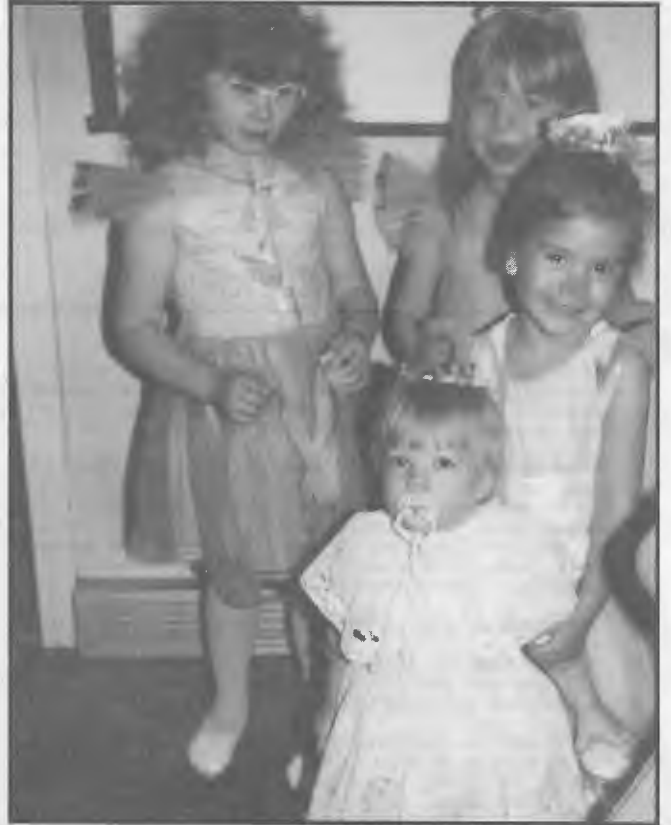
Dipolissa "Huomisen syntymä" kansainvälinen symposiumi 11.3.1991 Kaikki vuorollaan esiintymään.

Adelaidessa suomalaisten Suvipäivillä 1.1.1991 Tontut kesähelteellä.