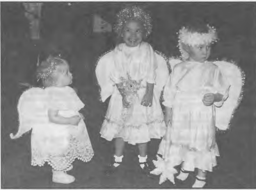
Pienimmät esiintivät myös Sydneyssä Tällä kertaa enkeleinä.