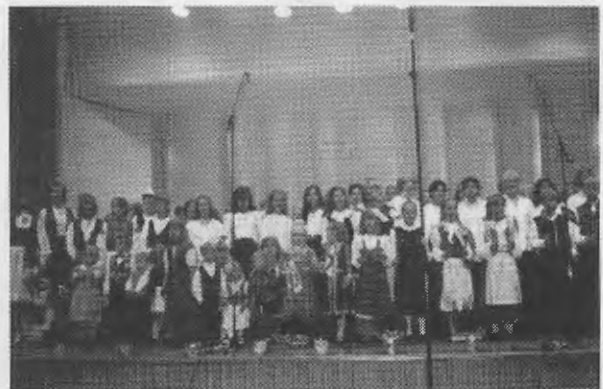
Esiintyminen yhteispohjoismaisessa Suzuki-konsertissa 23.10.1994