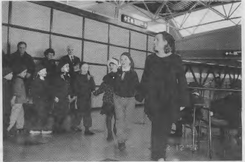
Joulupukin tontut lentokentällä

On hauskaa seurata ”Tuiki, tuiki tähtönen”-laulun esittämistä. Siitä se esiintyminen alkaa - usein arastellen - ja etenee hämmästyttävän nopesti oman konsertin pitämiseen. Esiintymiseen tulee rohkeutta ja varmuutta. Näiden lapsien polvet eivät tutise myöhemminkään elämässä.