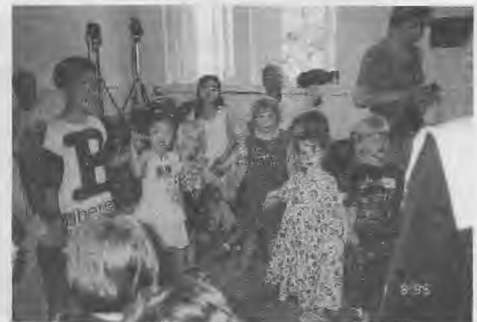
Suzukilaulutunti meneillään Irlannissa 1.8.1995