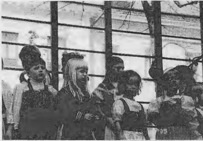
Valmiina esiintymään Esplanadin lavalla kesäkuussa 1995