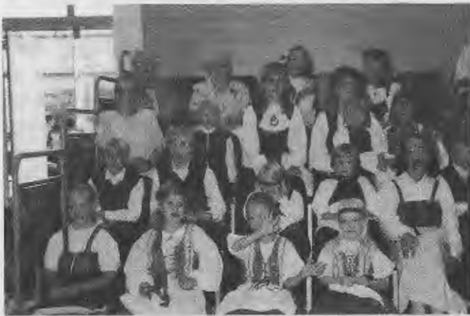
Vähän ennen konserttia Dublinissa 1995