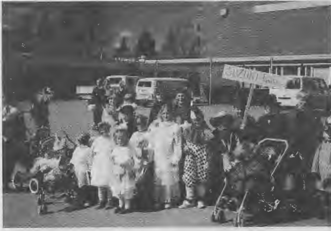
Suuren huijauksen kulkueen alkua odotellessa keväällä 1995