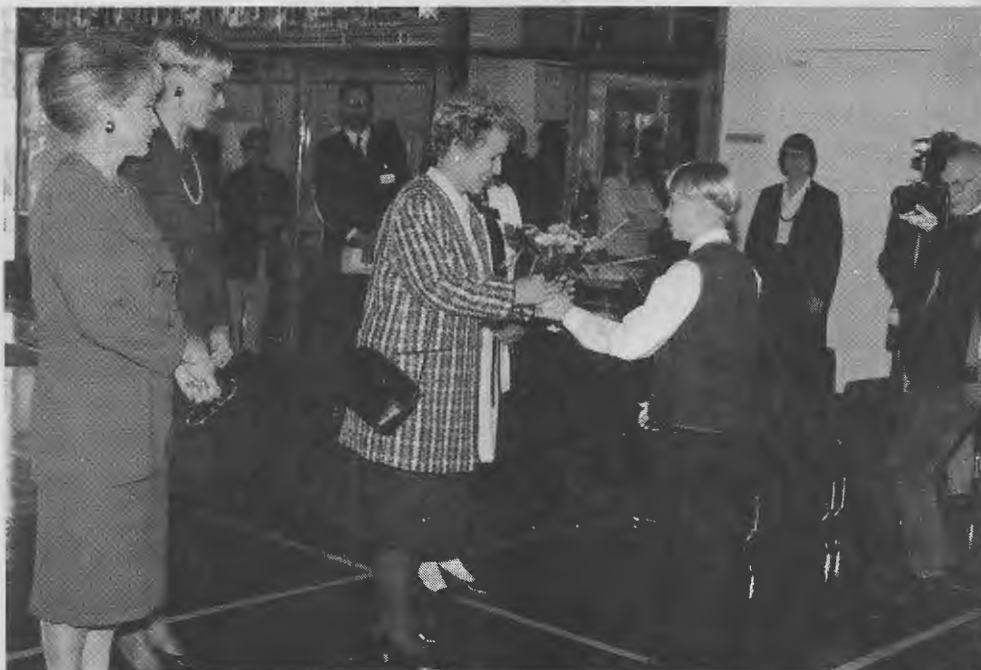
Eeva Ahtisaari Vantaan kaupungintalolla