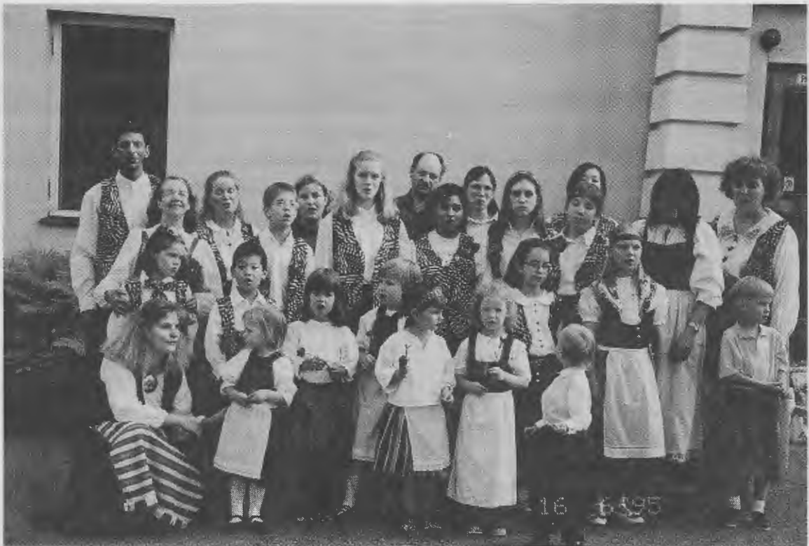
Texasilaisia ja suomalaisia suzukilaulajia Hämeenlinnassa kesäkuussa 1995