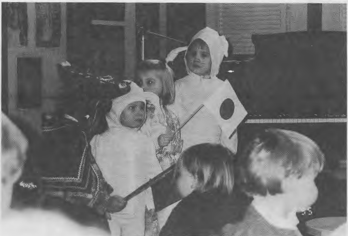
Laulupäivä taidetalo Pessissä