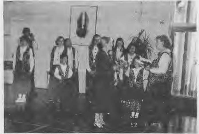
Teksasilaiset tervehtimässä kaupunginjohtaja Pirjo Ala-Kapeeta.